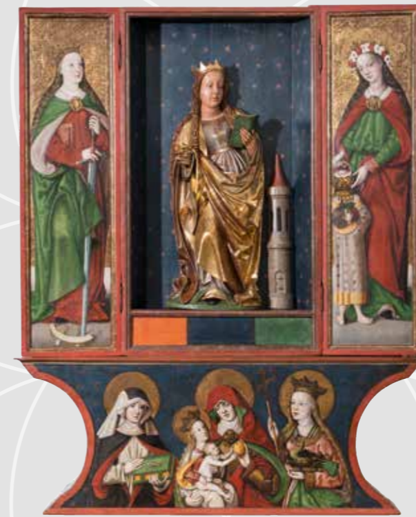
Hans Hesse (malby) a sochař francko-švábského školení, retábl se sv. Barborou , malby před 1513, tempera na smrkovém dřevě, zlacení, socha 1500–1510, lipové dřevo, polychromováno, Oblastní muzeum v Chomutově