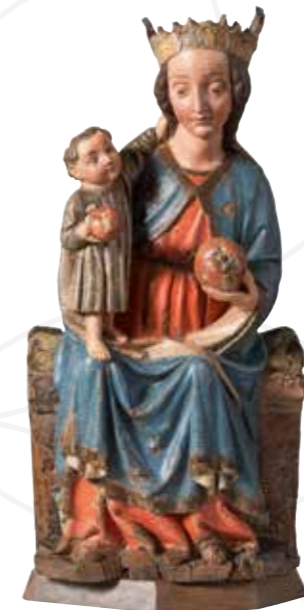
Trůnící Madona I. , 1410–1420, topolové dřevo, polychromováno, Oblastní muzeum a galerie v Mostě

Na titulní straně Tondo se sv. Annou Samotřetí , 1530, lipové (?) dřevo, polychromováno, Oblastní muzeum a galerie v Mostě