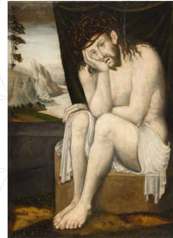
Mistr I. W. – kopista, Odpočívající Kristus , datováno 1585, olejová tempera na dřevě, Oblastní muzeum v Chomutově