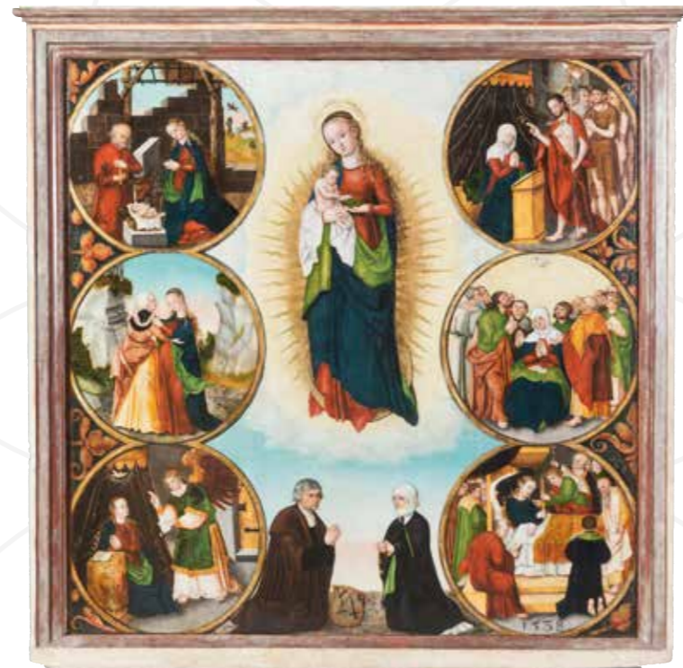
Mistr I. W., Votivní deska mostecká , datováno 1538, olej na smrkovém dřevě, Oblastní muzeum a galerie v Mostě

Otevírací doba: Út–Pá 9–17 hod., So 13–17 hod. Výstava je zpřístupněna virtuální prohlídkou. Text © Jitka Šrejberová, 2021 Typo © Marek Jodas, 2021 © Ústecký kraj, 2021 www.kr-ustecky.cz ; www.muzeumchomutov.cz ; www.muzeummost.cz